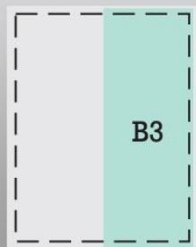
1/2 strony 79 mm x 225 mm cena 13 000 zł