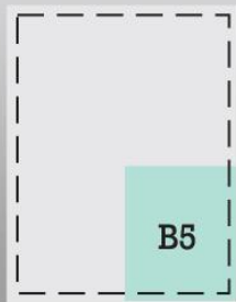
1/4 strony 79 mm x 112 mm cena 5 000 zł

str. 2 okładki 25 tys. str. 3 okładki 25 tys. str. 4 okładki 30 tys.